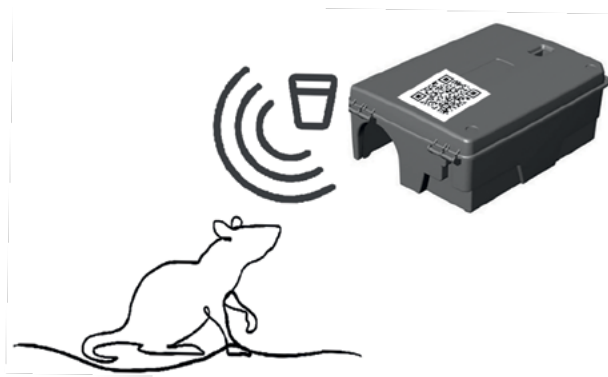
Рис. Вариант установки системы «Полуавтоматический ввод»