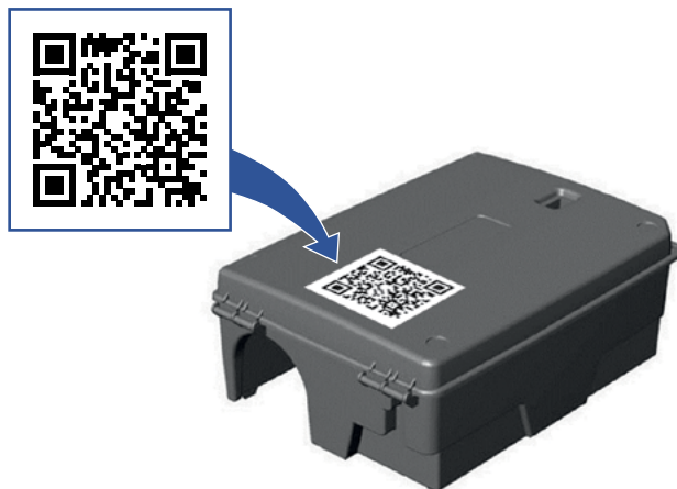
Рис. Вариант установки системы «Ручной ввод»

Не требуется установка дополнительного оборудования, работа ведется с приманочными станциями, уже установленными на объекте. Присваивается QR-код каждому имеющемуся контейнеру. Дезинфектор выходит на объект и, сканируя код с помощью специально разработанного телеграм-бота, вводит информацию по данному конкретному контейнеру, включая загрузку фото. Система фиксирует GPS-координаты объекта, на котором произошло сканирование кода, что полностью исключает возможность саботажа со стороны дезинфектора.